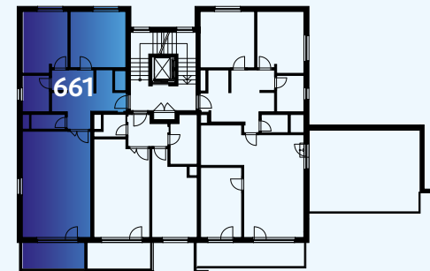
Celková situace / Site Plan