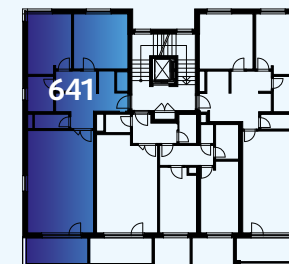
Celková situace / Site Plan