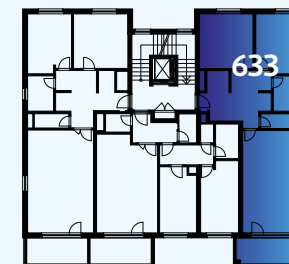
Celková situace / Site Plan