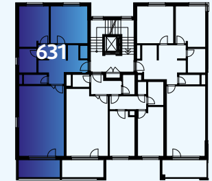
Celková situace / Site Plan