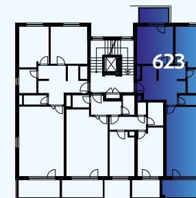
Celková situace / Site Plan