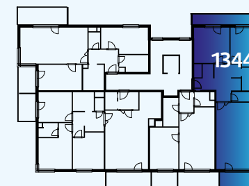
Celková situace / Site Plan