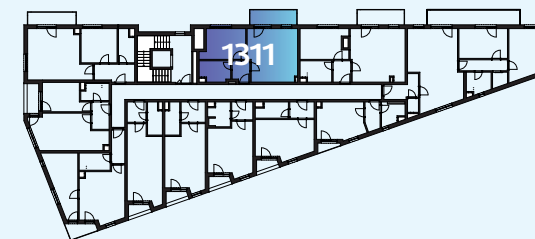
Celková situace / Site Plan