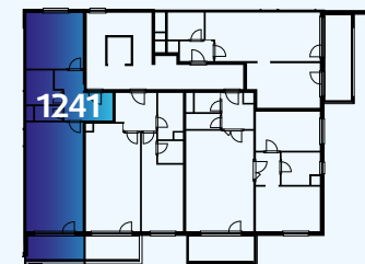
Celková situace / Site Plan