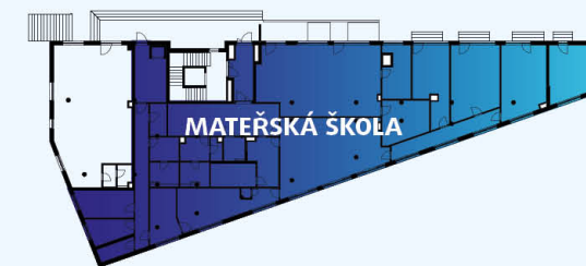
Celková situace / Site Plan